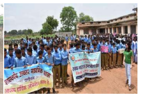
Cleanliness awareness rallies(33 rallies conducted)