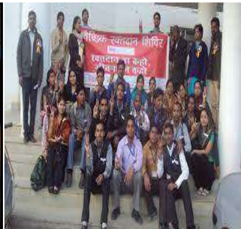
Awareness Through Handmade posters