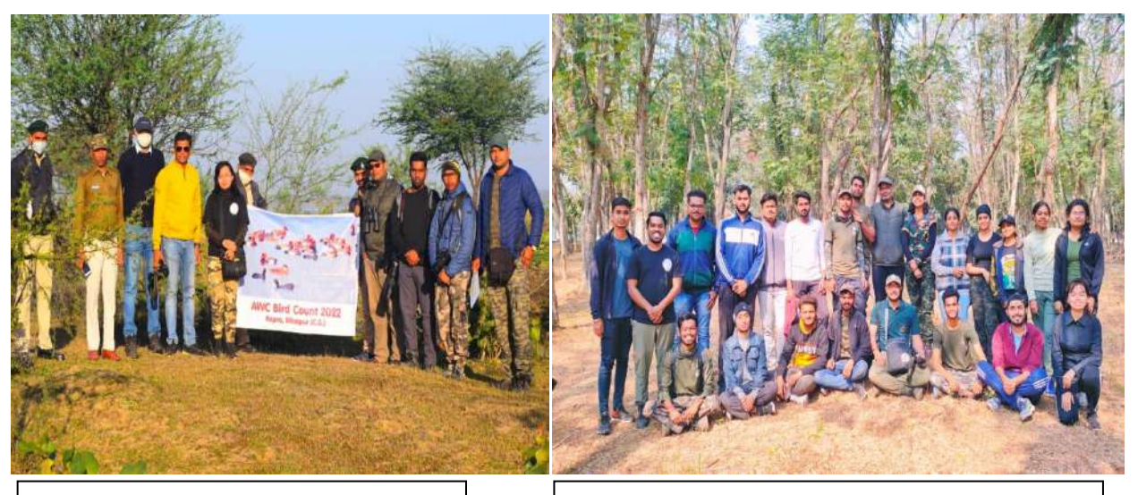
Group picture with forest department officials after birding