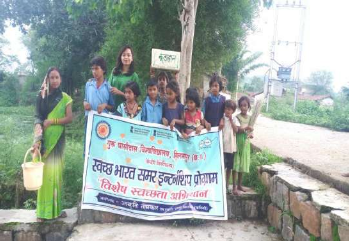
Pledge activity at rural areas

To raise awareness for cleanliness, students of GGV urge to take pledge between school students and village groups, during the pledge, school staff and principal mam and school students were present.