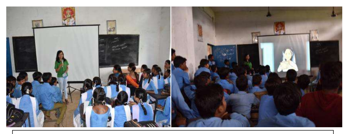
Movie screening in primary schools assisted by students of GGV

No. of participants: 5 Under the Banner of NSS