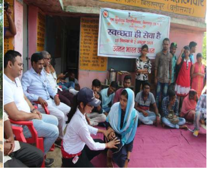
Group picture after awareness activity