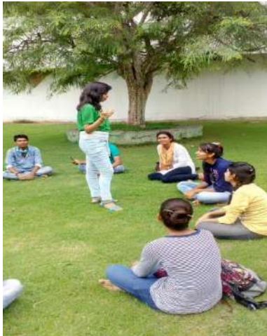
Awareness through Nukkad

Students have done many activities in this segment like rally with local police staff and with DSP mam, just to raise awareness for making green village, door to door awareness in villages to cover every age group of the society, they have done Nukkad also to sensitized more villagers.