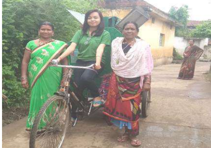
Door to door waste collection with Swachhta didi's