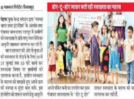
आकृति अपने इस अभियान में स्कूली बत्त्वों को खय घोने की सही विधि के तरिके बता रही हैं. इस सबका एक ही नारा, साफ सुध्य हो देश हमारा के नार के साथ देशी निकालकर लोगों को जानस्का कर सही हैं. वामीजों के साथ मिलकर दी होंगे पर पेटिंग व सुद्धे व गीले कचारे के उनित निप्पाट रेसी जानकारी देते हुए थेस्ट मदेरियल से कुझावान बनाने की कला गीरिका कर बाम के कर वर्ण के तोगों बों इस स्वच्छता अभियान से जोड़ने का प्रयास कर रही है.